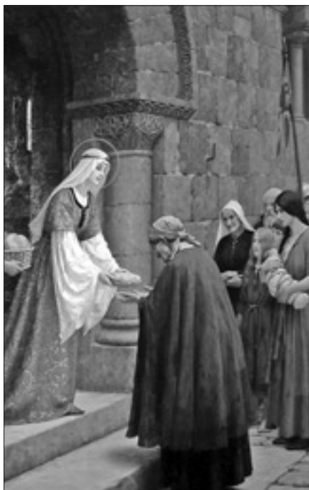
Edmund Blair Leighton, «Dobroczynność św. Elżbiety Węgierskiej» (1895 r.)

Jednakże w przypadkach, gdy wspomniane formy działania powstałyby z inicjatywy hierarchii bądź w sposób wyraźny były wspierane przez autorytet Pasterzy, trzeba zagwarantować, aby kierowanie tą działalnością odbywało się zgodnie z wymogami nauki Kościoła oraz z intencjami wiernych, a także aby respektowane były również normy prawne wydane przez władze świeckie. Wobec tych wy-