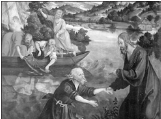
Hans Süß von Kulmbach, «Cudowny połów» (1480 r.)