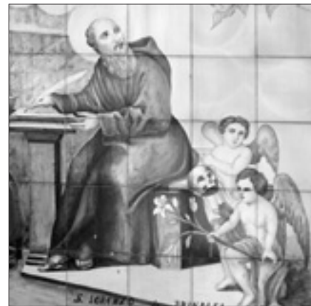
Św. Wawrzyniec z Brindisi (kościół kapucynów w Eboli, Włochy)

Pośród tych licznych zajęć Wawrzyniec pielęgnował swoje niezwykle żarliwe życie duchowe, poświęcając wiele czasu modlitwie, a w sposób szczególny odprawianiu Mszy św., co często trwało godzinami, tak bardzo pogrążał się w rozpamiętywaniu męki, śmierci i zmartwychwstania Pana. Ucząc się od świętych, każdy kapłan – jak to często było podkreślane podczas Roku Kapłańskiego – może uniknąć popadnięcia w aktywizm, czyli działania bez odniesienia do głębszych motywacji swojej posługi, jedynie pod warunkiem, że będzie się troszczył o swoje życie wewnętrzne. Przemawiając do kapłanów i seminarzystów w katedrze w Brindisi, rodzinnym mieście św. Wawrzyńca, przypomniałem, że «modlitwa jest najważniejszym momentem w życiu kapłana, w którym najsukcesyjnie działa łaska Boża, sprawiając, że jego posługa staje się owocna. Modlitwa jest pierwszą posługą należną wspólnotce. Dlatego chwile modlitwy muszą być w naszym życiu prawdziwym priorytetem (...) Jeśli nie jesteśmy wewnętrznie zjednoczeni z Bogiem, nic nie możemy dać również innym. Dlatego Bóg jest głównym priorytetem. Musimy zawsze przeznaczać odpowiednią ilość czasu na modlitwę zjednoczenie z naszym Panem». Zresztą z właściwą dla jego niepowtarzalnego stylu żarliwością Wawrzyniec zachęcał wszystkich, a nie tylko kapłanów, by pielęgnowali życie modlitwy, bo w niej zwracamy się do