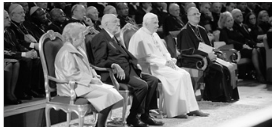
Prezydent Republiki Włoskiej Giorgio Napolitano z małżonką, Benedykt XVI i Sekretarz Stanu kard. Tarcisio Bertone na koncercie z okazji 70. rocznicy zakończenia II wojny światowej (8 października 2009 r.)

Proces zjednoczenia, który dokonał się we Włoszech w XIX stuleciu i przeszedł do historii pod nazwą Risorgimento (Odrodzenie), był naturalnym uwieńczeniem rozwoju tożsamości narodowej, który rozpoczął się o wiele wcześniej. Pomimo że na Półwyspie istniały różne wspólnoty polityczne, to naród włoski jako wspólnota osób, które łączyły język, kultura, poczucie wspólnej przynależności, zaczął kształtować się już w czasach średniowiecza. Chrześcijaństwo przyczyniło się do budowania tożsamości włoskiej w sposób zasadniczy poprzez działalność Kościoła, jego instytucji wychowawczych i opiekuńczych, kształtując wzory zachowania, układ stosunków między instytucjami, stosunki społeczne; a także poprzez niezwykle bogatą twórczość artystyczną: literaturę, malarstwo, rzeźbę, architekturę, muzykę. Dante, Giotto, Petrarca, Michał Anioł, Rafael, Pierluigi da Palestri-