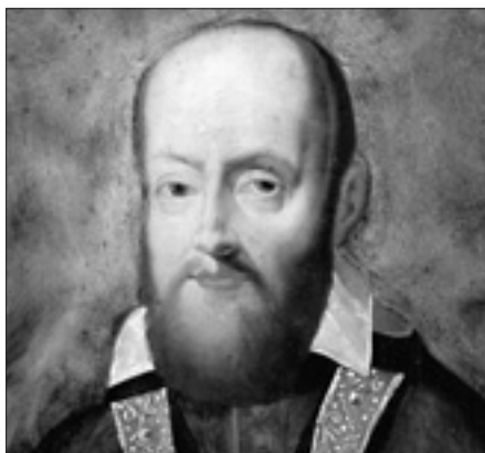
Św. Franciszek Salezy

Do Filotei, idealnego odbiorcy swojej Drogi do życia pobożnego (1607 r.), Franciszek Salezy kieruje wezwanie, które w tamtych czasach mogło sprawić wrażenie rewolucyjnego. Jest to zachęta, by całkowicie oddać się Bogu, w pełni żyjąc w świecie oraz wykonując zadania związane z własnym stanem. «Moiem zamiarem jest pouczyć tych, którzy żyją w mieście, w stanie małżeńskim, na dworze» (Wstęp do Drogi do życia pobożnego ). Dokument, którym papież Pius IX ponad dwieście lat później ogłosił go doktorem Kościoła, kładzie nacisk na to rozszerzenie powołania do doskonałości, do świętości. Czytamy w nim: «[prawdziwa pobożność] dotarła aż do tronu królów, do namiotu dowódców wojsk, do sali, w której zasiadają sędziowie, do urzędów, sklepów, a nawet do szałasów pasterzy» (browe Dives in misericordia , 16 listopada 1877 r.). Tak rodziło się dowartościowanie roli świeckich, troska o poświęcenie rzeczy doczesnych i uświęcenie spraw codziennych, na które położył nacisk Sobór Watykański II oraz duchowość naszych czasów. Powstał ideał człowieczeństwa pojednanego, łączącego harmonijnie działalność w świecie i mo-