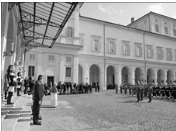
Benedykt XVI na dziedzińcu Pałacu Kwirynalskiego (4 października 2008 r.)

W budowaniu struktury polityczno-instytucjonalnej jednoczącego się państwa uczestniczyły różne postaci ze świata politycznego, dyplomatycznego i wojskowego, wśród których byli także przedstawiciele świata katolickiego. Jako że w procesie tym nieuchronnie trzeba było się zmierzyć z problemem doczesnej władzy papieża (również dlatego, że na zdobywanych stopniowo terenach było wprowadzane w dziedzinie kościelnej ustawodawstwo o orientacji silnie laicyzacyjnej), jego skutkiem były konflikty w indywidualnym i zbiorowym sumieniu katolików włoskich, rozdartych między wiarą a rzeczywistością.