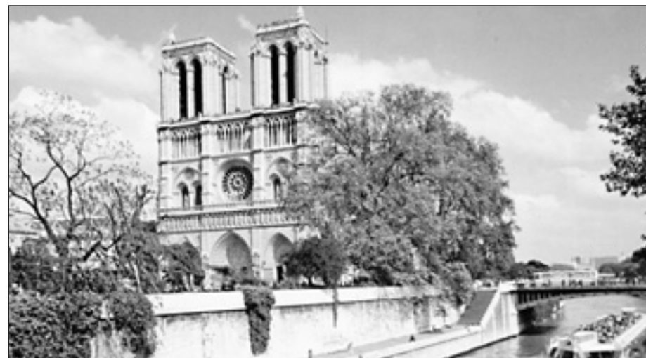
Paryska katedra Notre-Dame

To wy, drodzy młodzi, powinniście się starać o to, aby w waszym kraju i w Europie wierzący i niewierzący odnaleźli drogę dialogu. Religie nie mogą bać się słusznej laickości, laickości otwartej, która pozwala każdemu żyć tym, w co wierzy, zgodnie z własnym sumieniem. Jeśli mamy budować świat, w którym będą panowały wolność, równość i braterstwo, wierzący i niewierzący jako tacy muszą czuć się wolni, mieć równe prawa do osobistego i wspólnotowego życia w wierności swoim przekonaniom, i winni być dla siebie braćmi. Jedną z racji bytu tego Dziedzińca Pogan jest działanie na rzecz tego braterstwa niezależnie od przekonań, ale bez negowania różnic. A w głębszym jeszcze wymiarze, uznanie, że jedynie Bóg, w Chrystusie, wyzwala