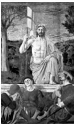
Piero della Francesca, «Zmartwychwstanie» (XV w.)

dzisiejszej liturgii – mamy jakby zapowiedź, antycypację tego, czym będzie 'nowe życie', czym powinno być 'nowe życie'. Rzesza tych, którzy stali się wierzącymi, miała jedno serce i jedną duszę. Jedną duszę, jedno serce: jedność, ta jedność, ta jednomyślność, ta harmonia uczuć w miłości, wzajemna miłość. To myślenie, że 'inni są lepsi ode mnie' – czyż nie jest to piękne?» «Ale rzeczywistość – wyjaśnił Papież – mówi nam, że po chrzcie to nie przychodzi automatycznie. To jest praca, którą trzeba wykonywać w czasie drogi życia, to jest praca, którą Duch ma wykonać w nas, i jest to wierność Duchowi z naszej strony». A «ta łagodność we wspólności jest cnotą nieco zapominaną. Bycie łagodnymi, zrobienie miejsca drugiemu. Jest tak wielu wrogów łagodności, poczynając od plotek, może nie? Kiedy woli się plotkować, obgadywać drugiego, skrytykować nieco drugiego. Są to rzeczy powszednie, które zdarzają się wszystkim, także mnie». «Są to pokusy złego ducha – kontynuował – który nie