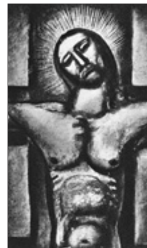
Georges Rouault, «Miserere», panneau 57

Ideologia fałszuje Ewangelię i osłabia również Kościół. Dlatego Papież Franciszek w homilii podczas Mszy św. nawiązał do dzisiejszych czytań liturgicznych (por. Dz 9, 1-20; J 6, 52-59), mówiących o nawróceniu św. Pawła pod murami Damaszku oraz o Ananiaszu, który został posłany przez Boga, aby przyjąć Szawła do Kościoła, a także uczonych w Piśmie, odrzucających słowa Jezusa. Wskazał, że Paweł i Ananiasz odpowiadają jak wielcy historii zbawienia, tak jak Jeremiasz, Izaasz, Mojżesz czy wreszcie Najświętsza Maryja Panna. «Jest to