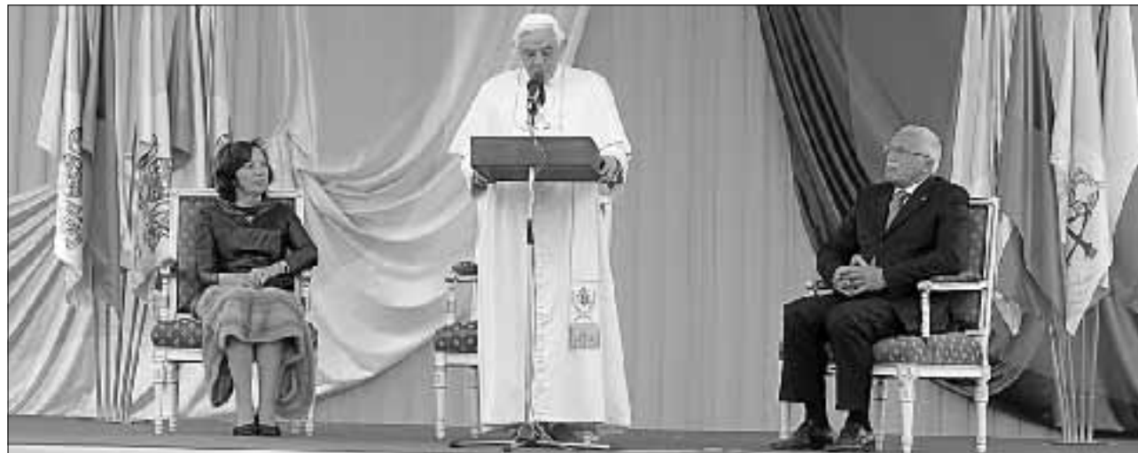
Ceremonia pożegnalna na praskim lotniisku Stará Ruzyně (28 września 2009 r.)

tyenty, niosąc wszędzie życie i zbawienie. Nad portalem katedry w Brnie widnieją słowa Chrystusa: «Przyjdźcie do Mnie wszyscy, którzy utrudzeni i obciążeni jesteście, a Ja was pokrzepię» (Mt 11, 28). Te same słowa rozbrzmiewały w ubiegłą niedzielę podczas liturgii, niczym echo odwiecznego głosu Zbawiciela, nadziei narodów, wczoraj, dziś i zawsze. Wymownym znakiem panowania Chrystusa, panowania łaski i miłości, są święci patroni różnych krajów chrześcijańskich, jak właśnie św. Wacław, młody król czeski z X w., przykładny świadek Chrystusa, zabity przez brata. Wacław cenił Królestwo niebieskie bardziej niż powaby władzy ziemskiej i pozostał na zawsze w sercu czeskiego narodu, był dla niego wzorem i opiekunem na przestrzeni burzliwych dziejów. Do licznych młodych, obecnych na Mszy św. ku czci św. Wacława, przybyłych także z pobliskich krajów, zwróciłem się ze słowami zachęty, by Chrystusa uznali za najprawdziwszego przyjaciela, który zaspokaja najgłębsze pragnienia ludzkiego serca.