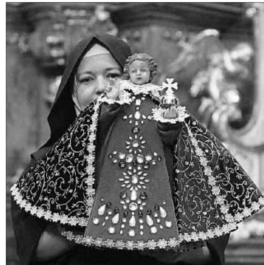
Siostra zakonna z «Praskim Dzieciątkiem Jezus»

Gdy Benedykt XVI przybył na błonia w Starym Bolesławcu, długo przejeżdżał papamobile między sektorami, entuzjastycznie witany przez wiernych, zwłaszcza przez licznie zgromadzoną młodzież. Homilię rozpoczął od złożenia życzeń imiennych obecnemu na Mszy św. prezydentowi Václavowi Klausowi i wszystkim innym solenizantom. Następnie, nawiązując do postaci św. Wacława, mówił o społecznym wymiarze świętości w naszych czasach. Pod koniec Eucharystii młodzi ofiarowali Papieżowi album fotograficzny, prezentujący różne formy dusz-