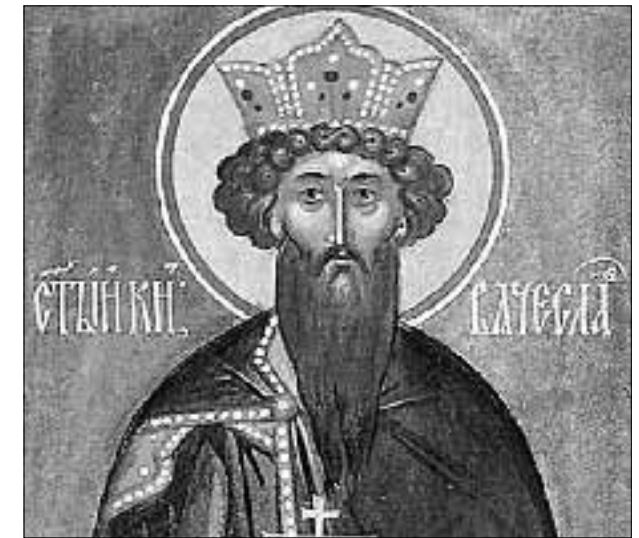
Św. Wacław, patron Czech

Zwracam się do was jako były profesor, któremu leżało na sercu akademickie prawo do wolności i odpowiedzialności za właściwe korzystanie z rozumu, a teraz jest papieżem, którego głos jako pasterza uznawany jest za ważny w etycznej refleksji człowieka. Cho-