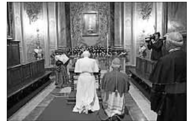
Ojciec Święty przed relikwiami św. Bonawentury w Bagnoregio (6 września 2009 r.)

Św. Bonawentura był zwiastunem nadziei. Piękny obraz nadziei znajdujemy w jednym z jego kazań adwentowych, w którym porównuje działanie nadziei do lotu ptaka, który rozpościera skrzydła jak najszerszej i